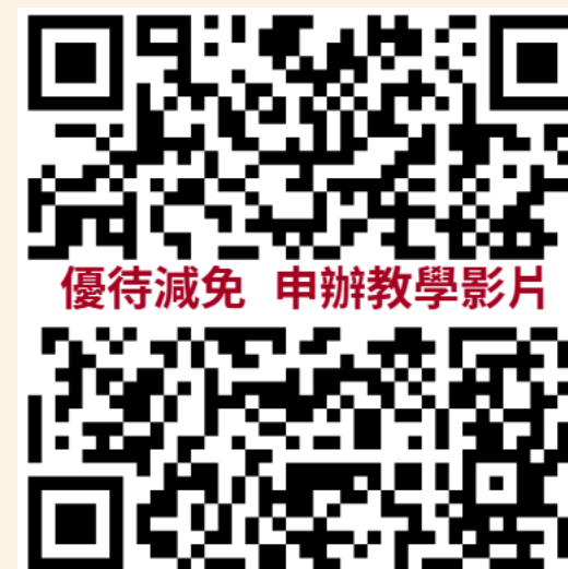
優待減免 申辦教學影片