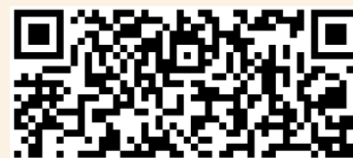
獎助學金圖文說明